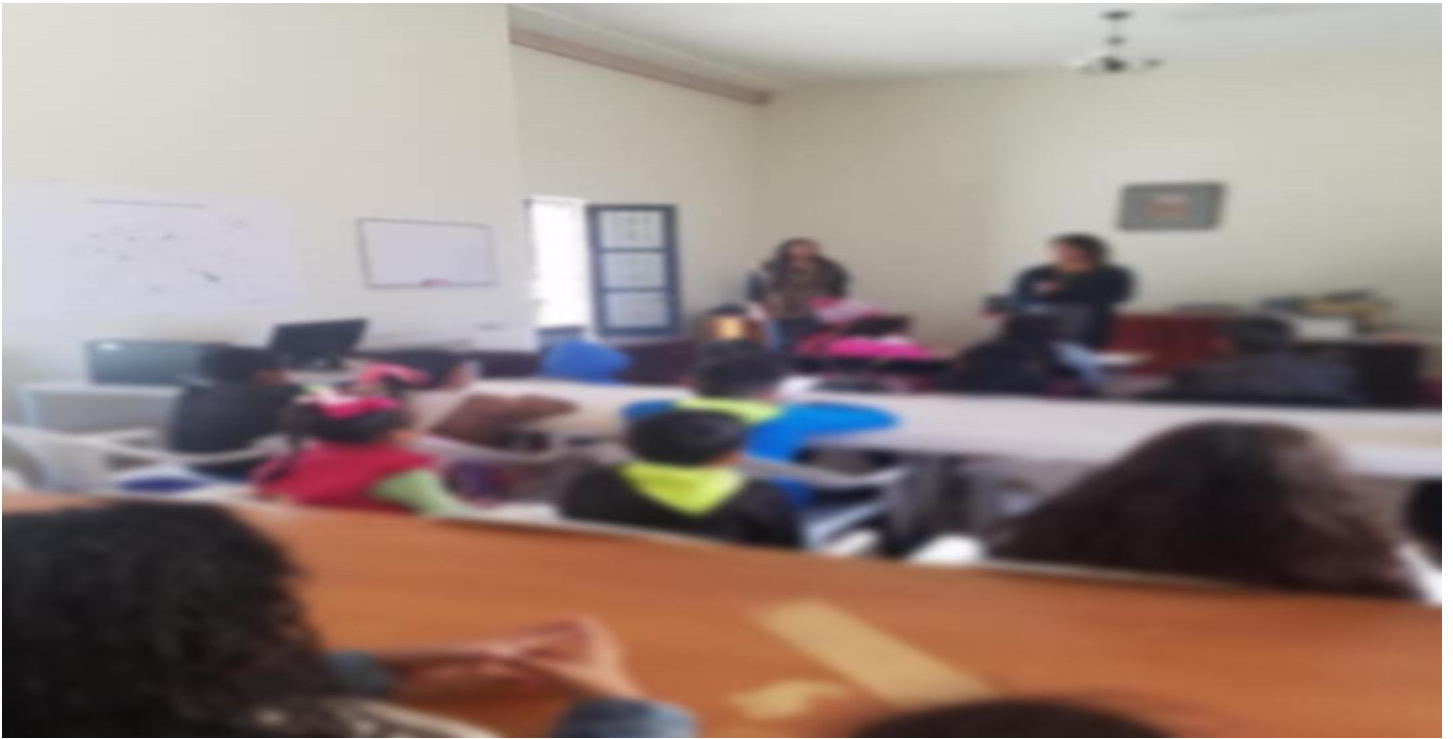
Acudimos al jardín de niños María Luisa Alba para impartir escuela a padres e hijos con la finalidad de unir los vínculos familiares para una mejor relación.