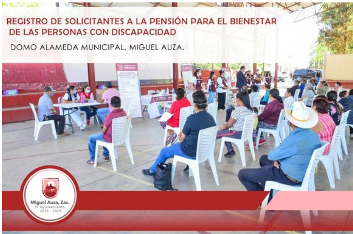
Se llevó a cabo el Registro de solicitantes para la Pensión del Bienestar de las Personas con Discapacidad en el domo de la alameda municipal, donde el área de comunicación social estuvo colaborando con la instalación y manejo de sonido así como con la cobertura del evento.

06/06/2022 COBERTURA A LA FINAL DE FÚTBOL ESTADIO GUILLERMO TALAMANTES.