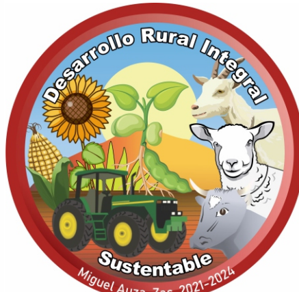
Miguel Auza, Zac. 2021-2024