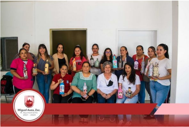
06 y 07/06/2022 COBERTURA DEL CURSO DE BOTELLA ARTESANAL POR EL IMMMA.