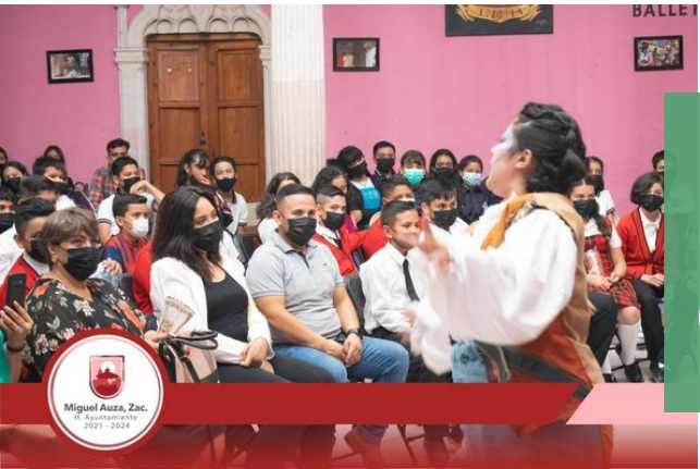
09/06/2022 DISEÑO ELABORACIÓN Y DIFUSIÓN DE CARTEL. COBERTURA DEL EVENTO.