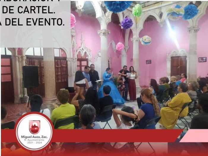
09/06/2022 DISEÑO ELABORACIÓN Y DIFUSIÓN DE CARTEL. COBERTURA DEL EVENTO.