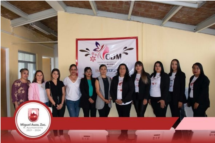
Iniciamos el mes de Junio cubriendo la inauguración del "CENTRO DE DESERROLLO PARA LA MUJER" (CDM).