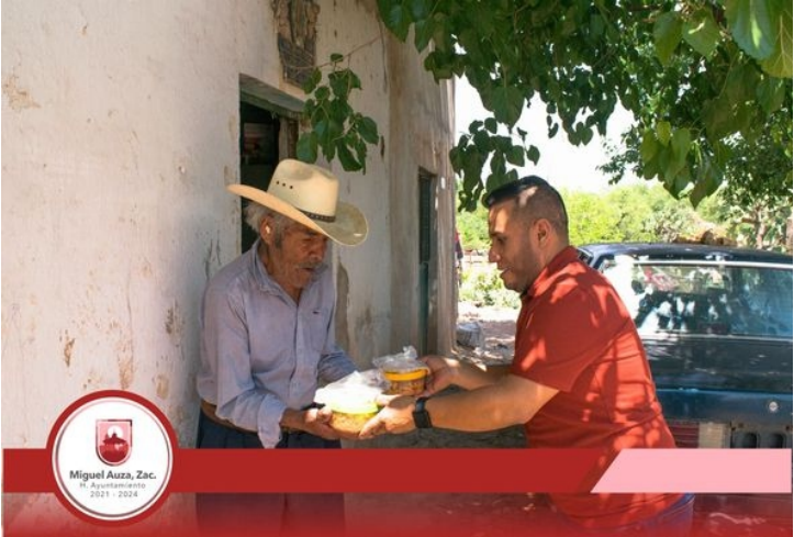
El día 03 de junio, acompañamos a personal del Sistema DIF al recorrido para la entrega del Programa de Desayuno caliente para Adultos Mayores en estado de abandono y vulnerabilidad, recabando evidencia de la legitimidad del apoyo en alimentación en desayuno y comida.