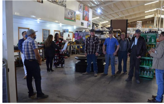
5. En diferentes ocasiones